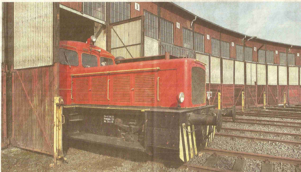
Der Ringlokschuppen ist eine der Attraktionen des Bahnbetriebswerkes in Bismarck.