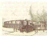
Schon farbig skizziert: Das Entree der Eisenbahnwelt.